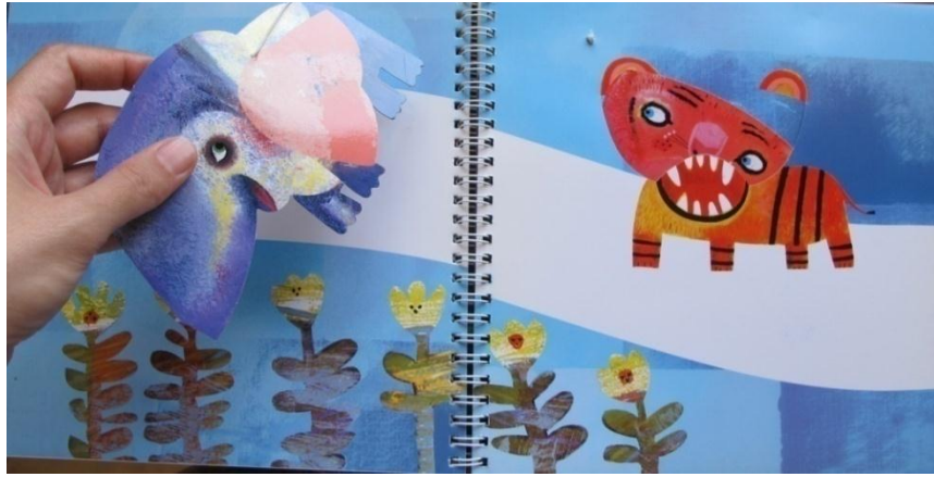
تصویر شماره‌ی ۶

۶-۳-۱۴. همین و همان: این شگرد در واقع برگرفته از نام کتاب همین و همان است. تصویرها در همان حال که خود به تنهایی معنادارند، می‌توانند با ورق خوردن یک صفحه، بخشی از تصویر صفحه‌ی پسین را نیز کامل کنند. این شگرد بیننده را وامی‌دارد تا به جای تمرکز بر یک تصویر، به دو تصویر توجه کند و با مقایسه‌ی پی‌درپی تصویرها، تفاوت‌ها و شباهت‌های‌شان را از یکدیگر باز شناسد. برای نمونه در یکی از بخش‌های کتاب همین و همان ابتدا تصویر گوزنی از نمای نزدیک دیده می‌شود؛ ولی با ورق خوردن نیمه‌ی پایینی، تصویر همان گوزن این‌بار از نمای دورتر و در میان شاخ و برگ درختان ظاهر می‌شود (تصویر شماره‌ی ۷).