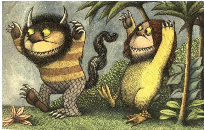
تصویر شماره‌ی ۲

وحشی بودن به خود گرفته‌اند شکل وارونه‌ی آنچه متن گفته‌است را نشان می‌دهد (تصویر شماره‌ی ۲).