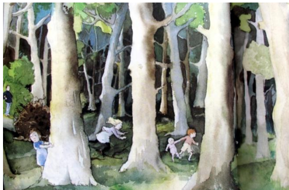
تصویر شماره‌ی ۳

۶-۳-۸. شوخی تصویری: به این معنا که یک تصویر به گونه‌ای دو پهلو به کار گرفته شود. به طوری که بیننده ابتدا به اشتباه بیفتد و آنچه را که منظور اصلی روایت است درنیابد؛ ولی با کمی دقت پی به خطای خود برد. از راه این شگرد بیننده از تمرکز بر دریافت نخست خود خارج شده، این بار تصویر را از زاویه‌ای دیگر می‌نگرد. در می‌خوایم یه خرس شکار کنیم، هنگامی که بچه‌ها به جنگل می‌رسند، فضای ترسناک حاکم بر جنگل، آن‌ها را در حالتی از بهت و نگرانی فرو می‌برد. پشت سر یکی از دخترها تنه‌ی درختی روی زمین افتاده است، به گونه‌ای که ریشه‌های قهوه‌ای رنگش قسمتی از فضای پشت سر دختر را در بر گرفته است. از آنجا که رنگ ریشه‌ی درخت هم رنگ موهای دختر است بیننده دچار خطا می‌شود و ریشه‌ی درخت را به جای موهای دختر فرض می‌کند. اگر بیننده دقت بیشتری کند متوجه اشتباه خود خواهد شد و به این ترتیب از دریافت نخست خویش فاصله می‌گیرد (تصویر شماره‌ی ۳).