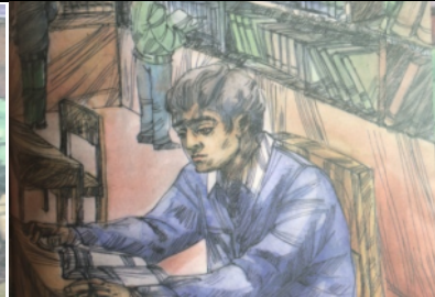
تصویر شماره‌ی ۹