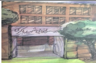
تصویر شماره‌ی ۱۰