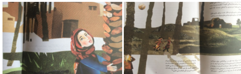
تصویر شماره ۷