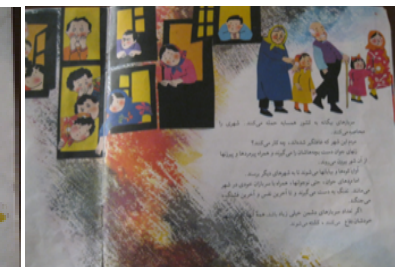
تصویر شماره‌ی ۱۱