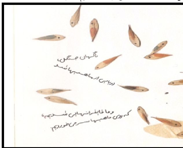
شکل شماره‌ی ۲: شناور بودن نوشته‌ها به صورت مورب بر روی آب در داستان دو دوست

متن داستان بسیار کوتاه است و در لابه‌لای تصاویر گنجانده شده است که ضمن ایجاد تنوع، ارتباط بصری بیشتری نیز برقرار می‌شود. آوردن متن نوشتاری کتاب به این شیوه در کیفیت خواندن مطالب و پیش‌برد داستان تأثیرگذار است و فرم ساده و