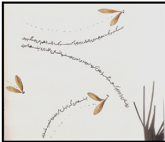
شکل شماره‌ی ۳: نقش نقطه در داستان دو دوست

هرچند نقطه بی‌شکل به نظر می‌رسد اما هنگامی که در یک کادر محدود مثل صفحه‌های کتاب قرار می‌گیرد حضورش محسوس می‌شود. نقطه در مرکز محیط خود، تعادل و سکون دارد و عنصرهای اطراف را در بر می‌گیرد و سازماندهی می‌کند. نقطه، ساده و ناچیزترین عنصر تصویر است که در شرایط ویژه، جلوه‌هایی تازه به خود می‌گیرد، حتی بیان تصویری تازه‌ای خلق می‌شود. (همان) شکل شماره‌ی ۳ یکی از نمونه‌های توجه به نقطه در داستان است که برای نشان دادن مسیر حرکت حیوانات از آن استفاده شده است. متن داستان هم متناسب با فرم انحنای حرکت پشه‌ها نوشته شده است که با شکل راست متن داستان‌های کودکان متفاوت است.