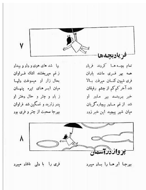
تصویر ۲. فری به آسمان می‌رود