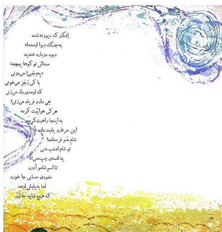
تصویر ۶. گل اومد، بهار اومد

می‌بینند و می‌پسندند» (محمدی و قایینی، ۱۳۹۴، ج ۱۰: ۱۱۹۵) البته شایان ذکر است در داوری کتاب، توأم شدن متن و نقاشی، نقص کتاب عنوان شده است.