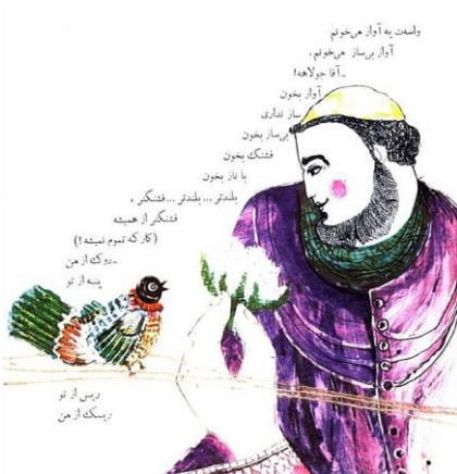
تصویر ۴. قصه‌ی طوقی