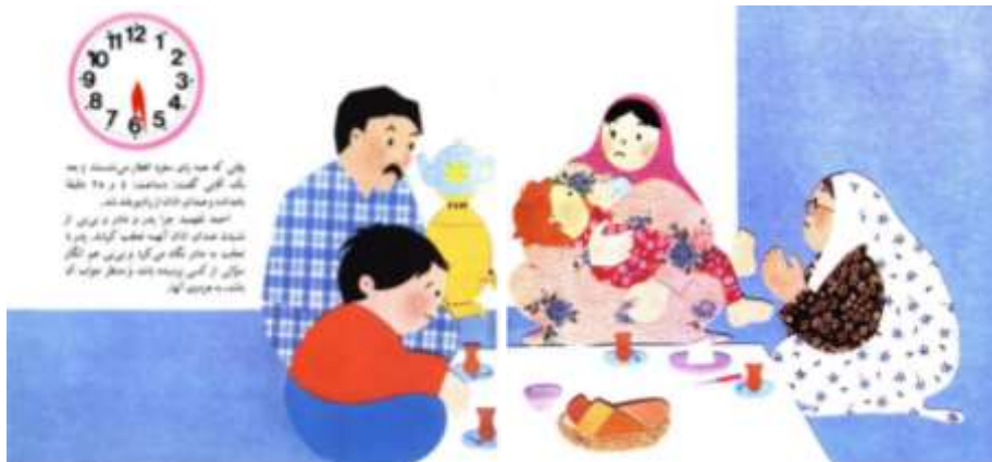
تصویر شماره‌ی ۷

در دو صفحه و خط جداکننده‌ی دو صفحه‌ی کتاب نیز این مرزبندی را به ذهن می‌آورد.