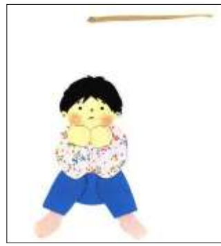
تصویر شماره‌ی ۱

چند نشانه مهم در همین درگاه ورود به دنیای متن / تصویر وجود دارد که خوانشی روان‌کاوانه را میسر می‌سازد. یکی از مهم‌ترین نشانه‌ها در رخدادهای متن عدد شش است. چنان‌که در چارچوب نظری هم آمد، شش‌سالگی مقارن آغاز دوران نهفتگی، رکود غریزه جنسی و تمرکز کودک بر فعالیت‌های مولد و سازنده است. این دوران پس از حل و فصل تعارض‌های اودیپی کودک آغاز می‌شود و پسر بچه‌ها باید در این سن از مرحله فالیک یا آلتی گذشته باشند. ماجرای احمد و ساعت، روایت آن بزنگاهی است که پسر باید سرانجام از مرحله اودیپی گذر کند و نقش پدر در این مرحله از رشد روانی جنسی کودک حیاتی است. به باور فروید، حل و فصل موفقیت‌آمیز درگیری‌های اودیپی زمانی اتفاق می‌افتد که پسر با پدرش هم‌ذات‌پنداری کند. «کودک در چهره‌ی پدر به این درک می‌رسد که شبکه‌ی اجتماعی و خانوادگی گسترده‌تری وجود دارد که او جزئی از آن است و نقشش نیز از قبل مشخص شده است» (ایگلتون، ۱۳۸۰: ۲۲۷). پسر بچه‌ها، ارزش‌ها، آرمان‌ها و هنجارهای اجتماعی پدر را درونی می‌کنند و فرامن یا سوپرایگو را تشکیل می‌دهند که به‌عنوان یک راهنمای اخلاقی درونی عمل می‌کند. این فرایند شناسایی به پسر کمک می‌کند تا در خود حس هویت جنسیتی ایجاد کند، انتظارات اجتماعی را بیاموزد و بین خواسته‌های خود و خواسته‌های اجتماعی تعادل برقرار کند. نقش پدر در مرحله فالیک، همان‌طور که فروید بیان کرده است، در تسهیل عبور موفقیت‌آمیز از مرحله اودیپی نقش اساسی دارد. حضور و مشارکت پدر، الگویی را برای پسر فراهم می‌کند تا با آن هم‌ذات‌پنداری کند و به