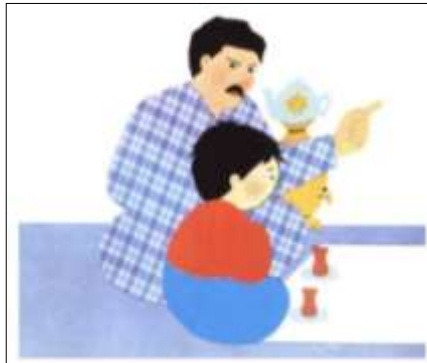
تصویر شماره‌ی ۴

بسته است و دست‌هایش جمع شده‌اند؛ درحالی‌که چهره پدر خشمگین است و دست او با انگشت اشاره برانگیخته به حالت تهدید و تنبیه پسر بچه بالا رفته است (تصویر ۴). این بار، این حالت دست پدر احمد هم یادآور قانونی است که پیش‌تر معرفی کرده بود و هم یادآور قدرت اخته‌سازی او است.